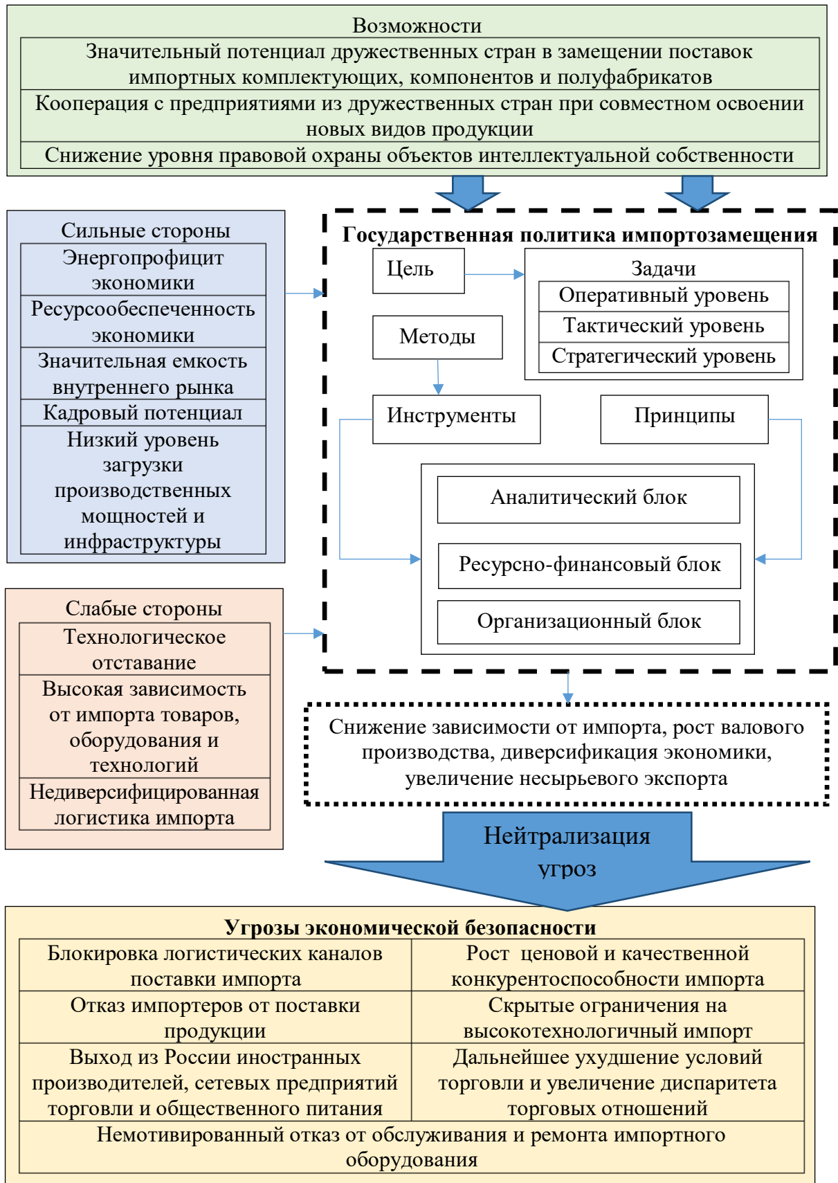
Рисунок 2 - Механизм нейтрализации угроз экономической безопасности на основе реализации государственной политики импортозамещения