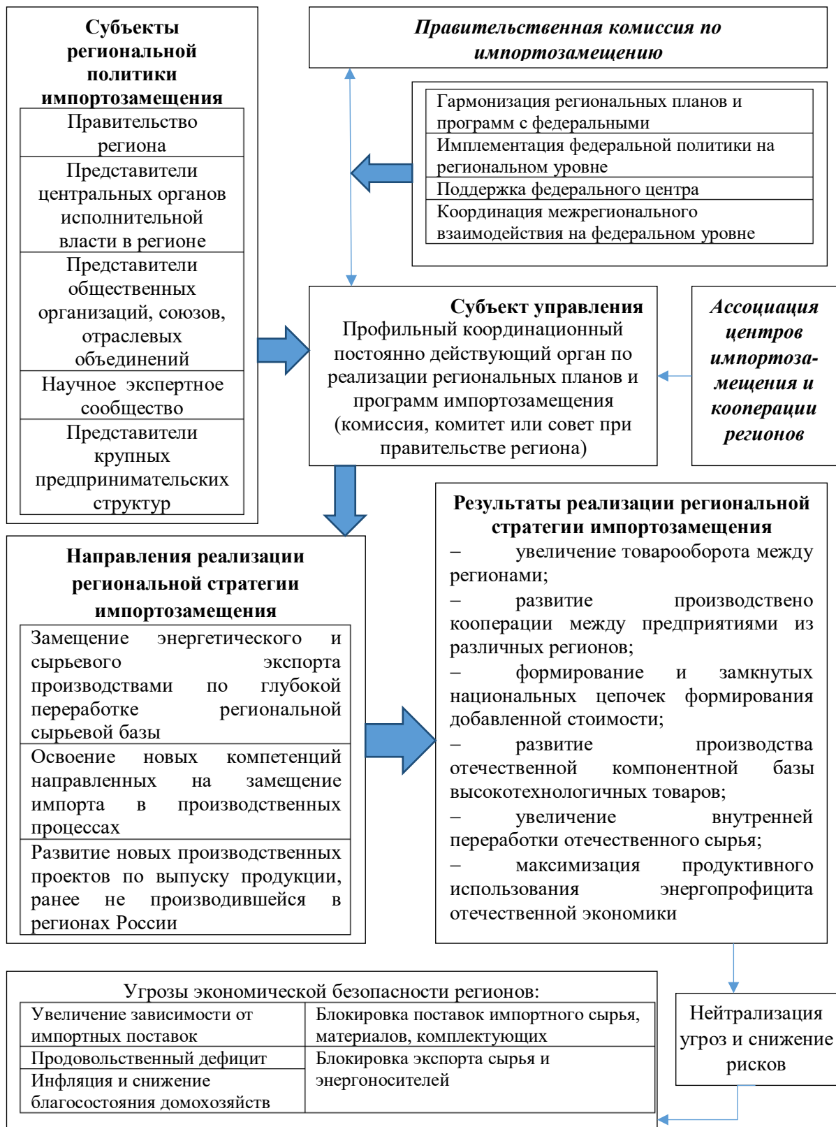
Рисунок 3 – Механизм обеспечения экономической безопасности регионов на основе использования резервов развития внутреннего рынка

реализации в прошлых периодах, а также региональных особенностей, связанных с обеспеченностью ресурсами, производственным и др. потенциалом территорий.