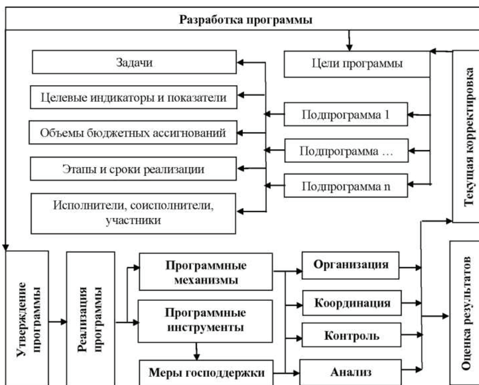
Рис. 1. Блок-схема формирования и реализации государственных программ по принципам программно-целевого управления (разработано автором)

Благодаря комплексной и системной государственной поддержке, привлечению инвестиций и применению программно-целевого управления агропромышленный комплекс региона демонстрирует устойчивый и уверенный рост. Отмечается устойчивый рост производства сельхозпродукции, по темпам выше среднероссийских показателей. В 2020 г. произведено сельхозпродукции на 91,6 млрд руб., что в сопоставимых ценах на 10,9% выше уров-