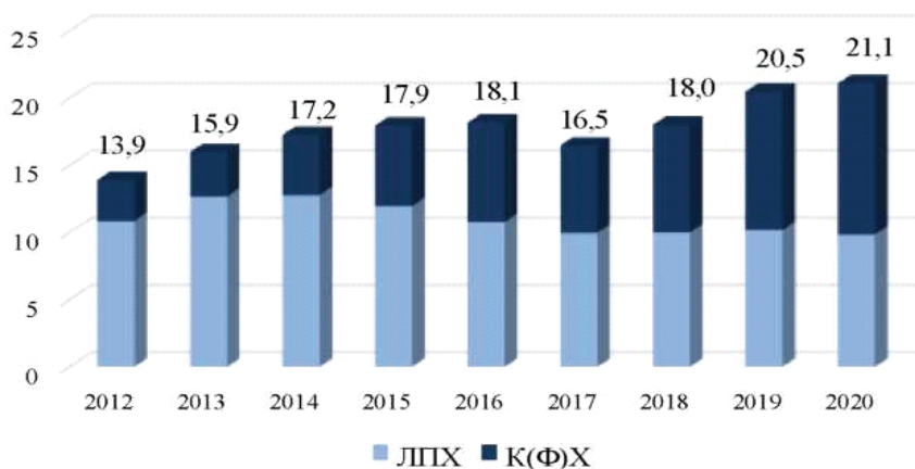
Рис. 3. Объем сельхозпродукции, произведенной МФХ Орловской области в действовавших ценах, млрд руб. [3]

Кроме этого, государственная поддержка сельскохозяйственных потребительских кооперативов в 2021 году предусматривает выделение средств на формирование системы поддержки КФХ и СПоК в целях, в частности: приобретение техники и оборудования для внесения в неделимый фонд СПоК (возмещение 50% затрат до 10 млн рублей), приобретение имущества с целью передачи в