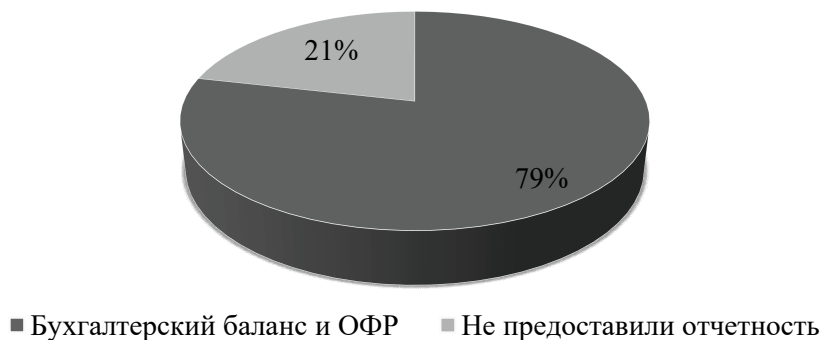
Рис. 1. Отчетность потребительских обществ

Отмеченные выше поступления финансовых средств служат основой создания фондов потребительских обществ: паевого, неделимого и резервного; а также фор-